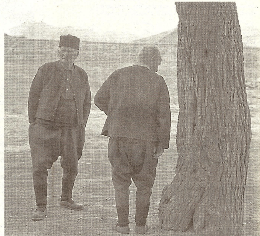
Двама мъже от село Йерусалимово, Тракия, 1979 г. „Село Йерусалимово първоначално било разположено високо в планината близо до Хасково. Когато бях там обаче, селото вече беше преместено в подножието на планината, за по-лесен достъп на жителите му до вода, ток и други удобства. Както при много други такива села, след построяването на пътища, свързващи ги с околния свят, много от жителите им ги напуснали, за да се преместят в градовете. Докато чакахме да се съберат участниците в хорото, което щяхме да снимаме в това село, погледнах през прозореца на читалището и останах поразен от двамата мъже, застанали до близкото дърво. Макар че и те, и дървото бяха белязани от времето, същевременно излъчваха безмилно достойнство и твърдост“, разказва Кейниг.

Снимките му от 60-те и 70-те години на миналия век ще видим на изложба, която се открива по инициатива на Илиана Йотова