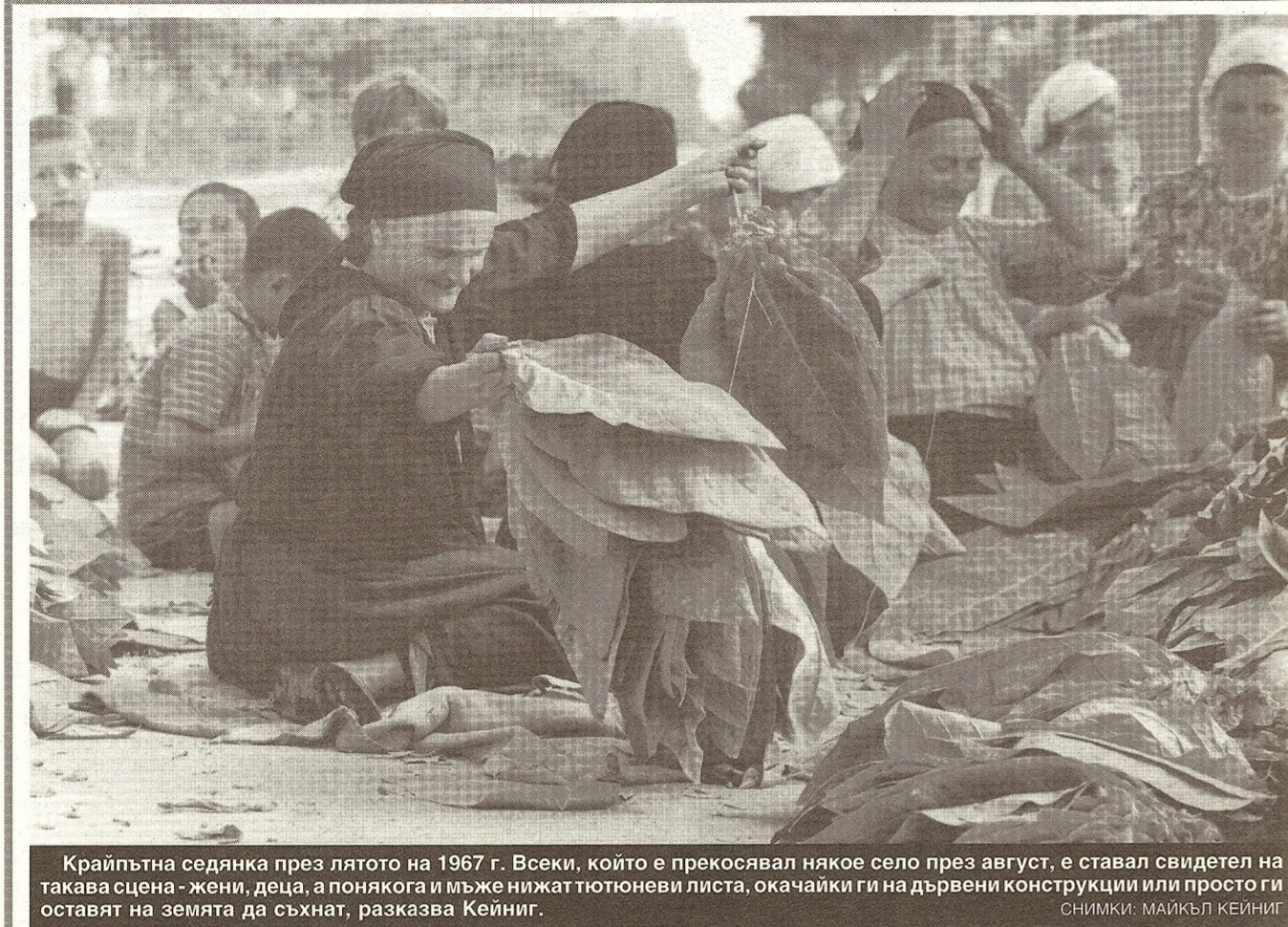
Крайпътна седянка през лятото на 1967 г. Всеки, който е прекосявал някое село през август, е ставал свидетел на такава сцена - жени, деца, а понякога и мъже нжиат тютюневи листа, окачайки ги на дървени конструкции или просто ги оставят на земята да съхнат, разказва Кейниг.