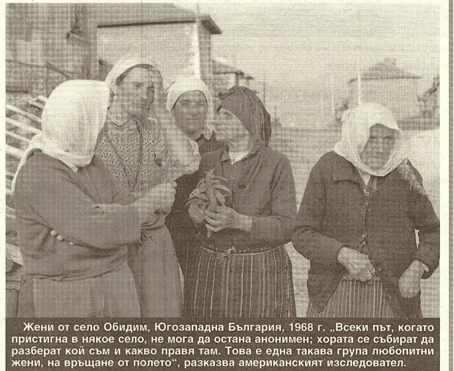
Жени от село Обидим, Югозападна България, 1968 г. „Всеки път, когато пристигна в някое село, не мога да остана анонимен; хората се събират да разберат кой съм и какво правя там. Това е една такава група любопитни жени, на връщане от полето“, разказва американският изследовател.