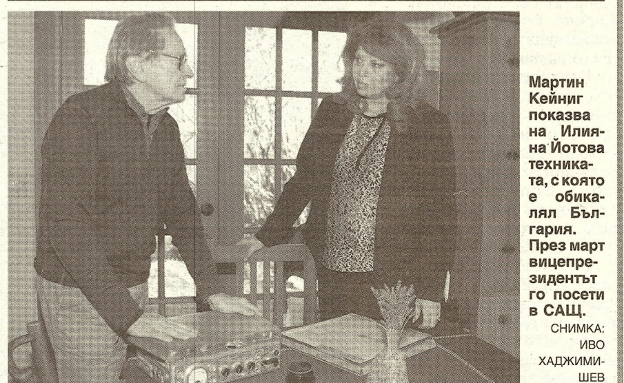
Мартин Кейниг показва на Илиана Йотова техниката, с която е обикалял България. През март вицепрезидентът го посетил в САЩ.