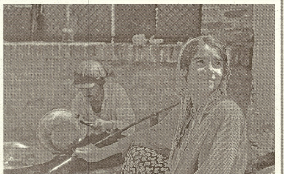
Бакърджии, Пловдив, 1969 г. Кейниг разказва: „Веднъж минавах през Пловдив и реших да се поразходя из Стария град, където снимах този ромски бакърджия и младата му помощничка. Във всички балкански държави има голяма концентрация на роми, древен и независим номадски народ (роми е предпочитаното от самите тях наименование, обикновено наричани цигани в разговорния език).“

Патрон и на двете събития е вицепрезидентът Илиана Йотова. Тя се запознава с Кейниг през март тази година - по време на визитата си в Западна бряга на САЩ. Дори гостува в дома му на остров Вашингтон край Сиатъл. Йотова е впечатлена от любовта на американеца към България, от желанието му да опазва и разпространява българските традиции и култура и му предлага да направи изложба.