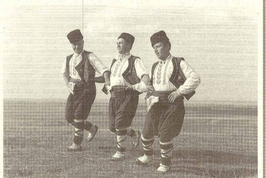
Триманцьори от село Айдемир, Добруджа, България, 1979 г. Обяснението на Кейниг е: В село Айдемир има малък ансамбъл от четирима танцьори, трима от които успях да заснема. На тази снимка са по-възрастните мъже, 50-60-годишни, израснали в селото и играли заедно в продължение на дълги години. Казват, че танцовият репертоар на Добруджа е по-богат и разнообразен от този на съседна Тракия.