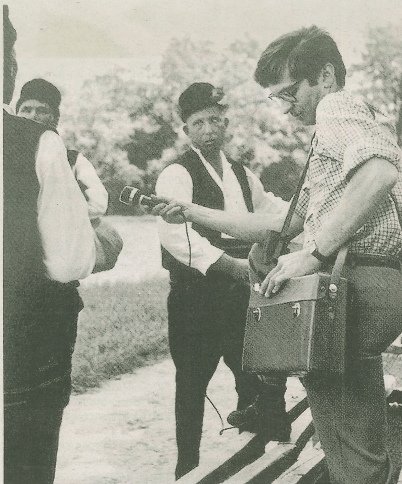
▲ 1967 г. Мартин Кейниг записва на магнетофона си участници във фолклорния фестивал в Ямбол.

На 18 септември в Националната художествена галерия ще бъде открита документална фотоизложба от 73 фотографии на американския етнограф Мартин Кейниг. Изложбата „Ехо от Балканите XX век: Портрети и звуци от България“, която ще продължи 2 месеца, е под патронажа на вицепрезидента Илияна Йотова, а неин съставител е известният фотограф Иво Хаджимишев.