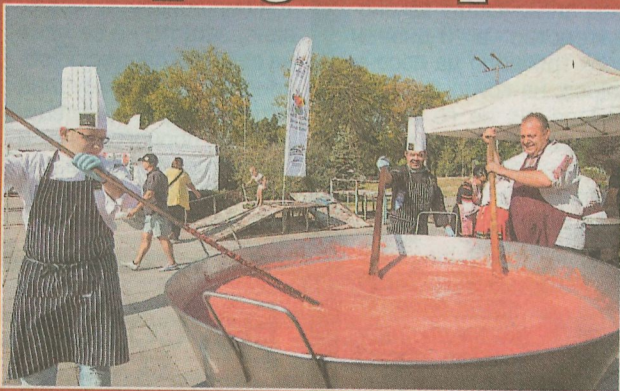
В огромен тиган ще бъдат редуцирани доматите за юнашката лютеница.

Третото издание на празника ще събере производители на розови домати и уникални български земеделски продукти, автентични български сирена, популярни шеф готвачи и майстори на традиционна българска кулинария. Учат производители на сладкия реселешки лук, уникалния смилянски боб и на български фермерски сирена. Авторски доматени ястия, подготвени от най-добрите софийски готвачи и рес-